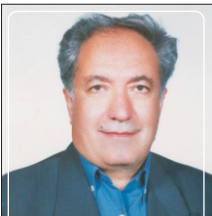
یک میلیارد ریال کمک به طرح توسعه دانشکده فنی