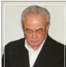
احداث دانشکده فنی فومن وابسته به دانشکده فنی