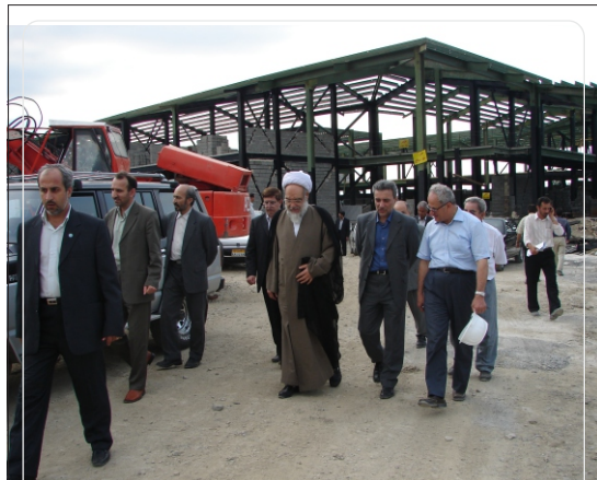
ساخت دانشکده فنی فومن از دو سال پیش آغاز شده است

مدیرعامل گروه صنعتی فومن شیمی، با امضای وقف نامه و موافقت نامه ای با دانشگاه تهران، موقوفه ای شامل حدود ۷۰۰۰۰ متر مربع زمین، ۵۰۰۰ متر زیربنا و تجهیزات کامل را جهت تأسیس دانشکده فنی فومن اختصاص داد.